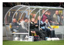
Een prachtig staaltje vrijwilligerswerk!

▶ De door de 'Vriendenclub VV Zwartemeer' aangeboden nieuwe dugouts op het hoofdveld zijn eerder gereed dan verwacht. Dit door een enorme inspanning van een groep vrijwilligers Het resultaat mag er zijn, ook v.w.b. die van veld 2 trouwens die al in een eerder stadium door min of meer dezelfde groep zijn gemaakt.