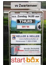
De vernieuwde infoborden

► Het grote bord, waarop onze sponsors zijn gepresenteerd, is gerenoveerd en voorzien van nieuwe borden.